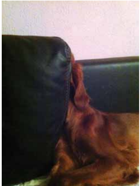
Im Oktober 2013 Brigitte, Bryony, Neva und Aileen