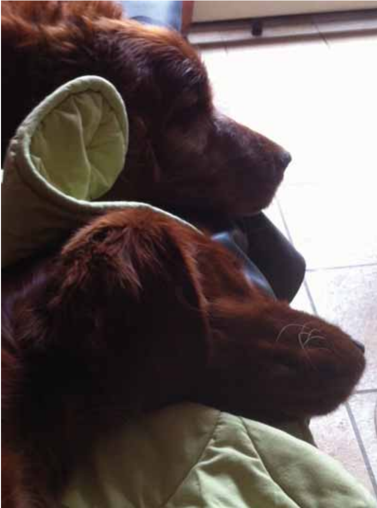
Jung (8 Monate) und alt (13.5 Jahre)

Danken möchte ich an dieser Stelle noch Stéphanie für die liebevolle Aufzucht und den wunderbaren Start ins Leben, den sie Aileen und ihren Geschwistern ermöglicht hat. Im Alltag darf ich erfahren, wie viel das Wert ist und was für eine tolle Hündin Aileen ist.